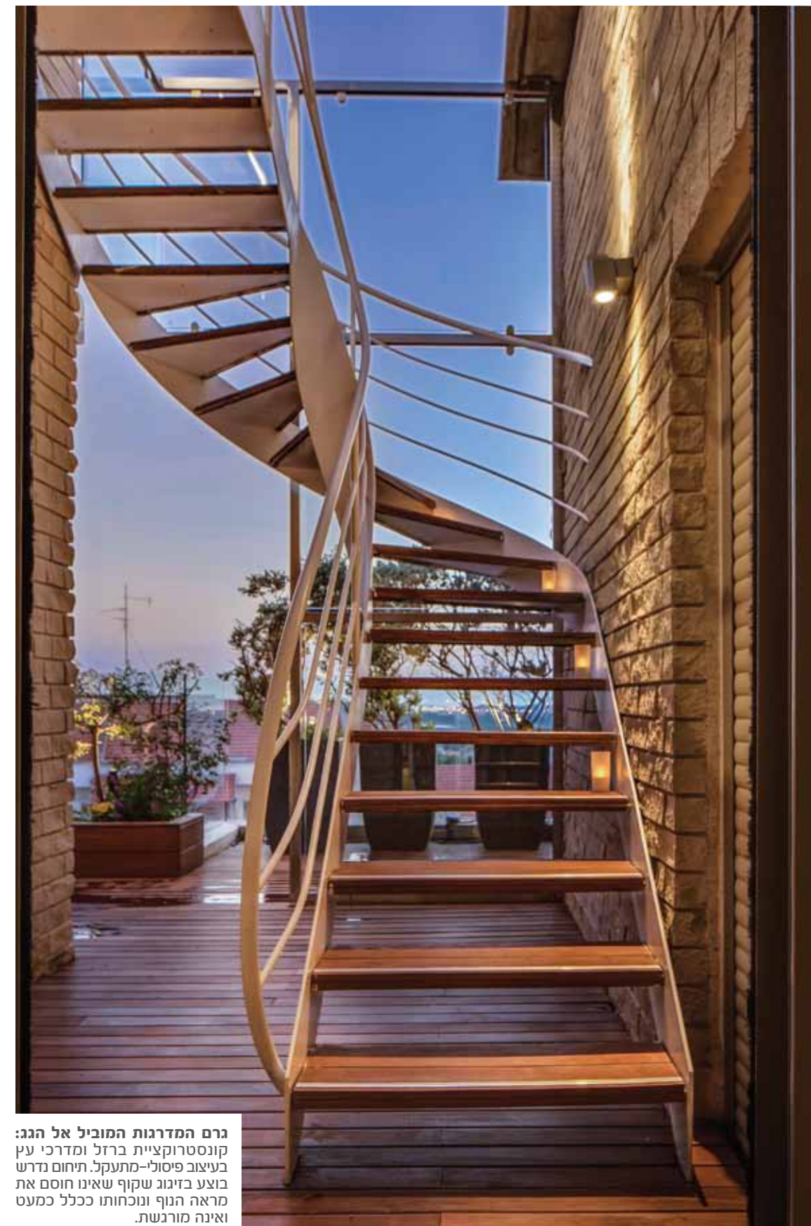
גם המדרגות המוביל אל הגג: קונסטרוקציית ברזל ומדרכי עץ בעיצוב פיסולי-מתעקל. תיחום נדרש בוצע בזיווג שקוף שאינו חוסם את מראה הנוף ונוכחותו ככלל כמעט ואינה מורגשת.

מאת: עידית אסא