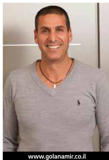
www.golanamir.co.il תכנון ועיצוב: אמיר גולן, "גולן אדריכלים"

אחד הבונוסים השמורים לדירות פנטהאוז הוא גג או מרפסת גדולה המאפשרים ליהנות מתחושת חוץ גם כשנמצאים בגובה, ואת התחושה הזו ביקש המעצב אמיר גולן למצות מיטבית בגג הדירה הממוקמת בהרצלייה. כך, לאחר שסיים לעצב את חללה הוא "עלה לגג" במטרה להפוך גם את שטחו למרחב מפנק, מותאם לאירוח ולשהייה מהנה. "הרעיון היה לייצר מרחב אירוח לכל דבר רק חיצוני, תוך שילוב אלמנטים כמים וצמחייה בהשראת גינות זן" אומר גולן על מה שנחשף כאן לעין- 140 מ"ר שהפכו לסוג של "מתחם" מרשים, מוקפד למשעי ובעיקר מזמין. בתהליך התכנון עיצוב ניתנה לגולן יד חופשית, ולמעשה, הוא מספר "הדיירים ראו כבר את התוצר המוגמר, כשהעיצוב הושלם עד אחרון פרטיו". הכשרת הגג ליעודו החלה בהיבטים טכניים, דוגמת איטום איכותי שבוצע בשטחו כפרמטר רב חשיבות, או תכנון מקדים